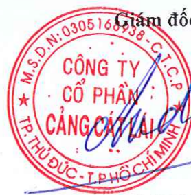
Võ Thái Hậu